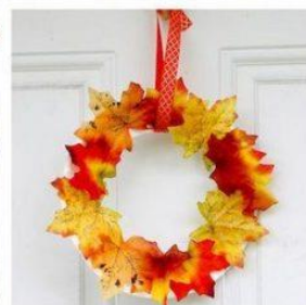
How to Preserve Leaves